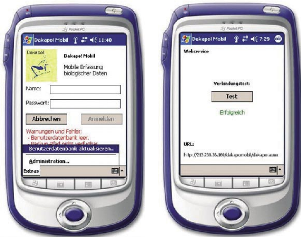
Dakapo! mobil: Die mobile Eingabemöglichkeit per PDA / MDA

und ihre Ergänzungen und Änderungswünsche gleich in das Dokument einpflegen. Das erleichtert für leguan die Kommunikation mit dem Kunden und die Zusammenarbeit verschiedener Personen, da jeder die Änderungen anderer sieht und seinerseits kommentieren kann.