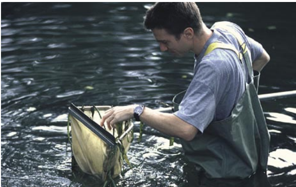
Einzel im Gelände – und doch perfekt eingegliedert ins Projekt